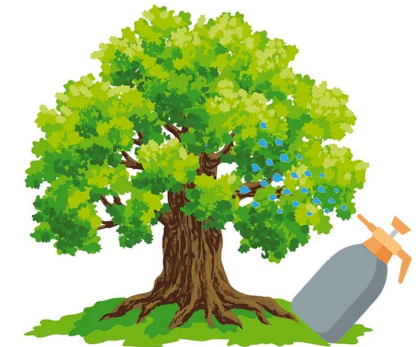
Traiter le feuillage face avant et face arrière et remuer régulièrement la préparation