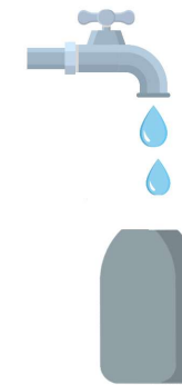
Compléter avec de l'eau