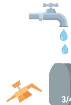
Remplir au 3/4 le pulvérisateur d'eau