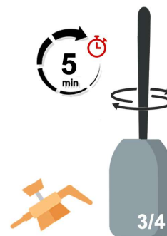
Attendre 5min que les sachets se dissolvent et mélanger