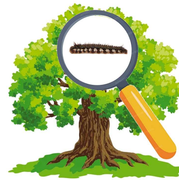
Repérer les chênes attaqués par les chenilles

Nom homologué : WASCO JARDIN - N° AMM : 2030175 - Emploi autorisé dans les jardins - Détenteur de l'AMM : Certis Europe BV (5 rue Galilée 78280 Guyancourt) - Composition : Bacillus thuringiensis subsp. kurstaki souche SA-11 - 32 000 000 ul/g - Formulation : Granulé dispersable dans des sachets hydrosolubles (WG-SB) - Type d'action du produit : Insecticide (traitements des parties aériennes) - Mode d'action : Ingestion